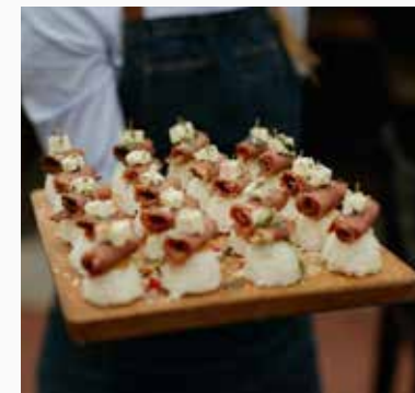
Hospůdka U Bobra