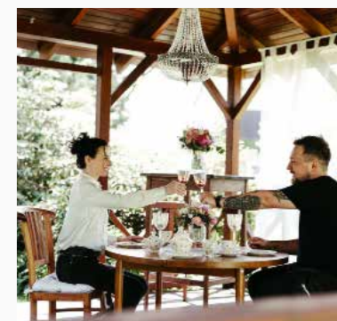
Mlýn vodníka Slámy

Valašská hospoda U Janíka Mlýn vodníka Slámy Restaurace Imrvére Harenda Přístav Kostkov Nha Cretcheu