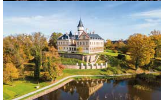
Akce na zámku