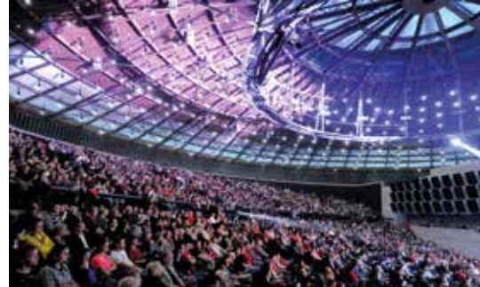
Slavnostní místa pro setkávání